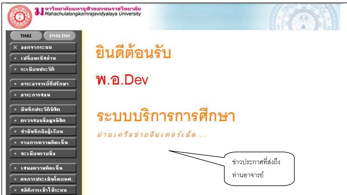
รูปที่ 5 หน้าจอระบบงานของอาจารย์

เมื่อท่านเข้าสู่ระบบเรียบร้อยแล้ว ระบบจะแสดงหน้าจอเมนูหลักระบบงานของอาจารย์ โดยมีเมนูแสดงฟังก์ชันต่างๆที่ท่านอาจารย์สามารถใช้งานได้แสดงอยู่ทางด้านซ้ายของจอภาพ ดังรูปต่อไปนี้